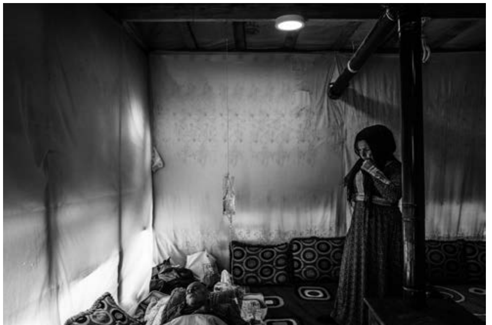
Fotopříběh o životě sýrských utečenců v Libanone: John Vink a Martin Bandžák